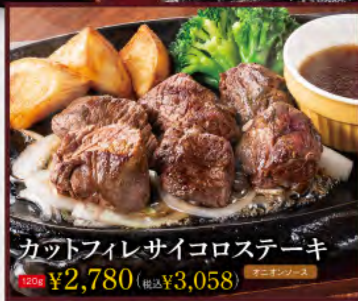
カットフィレサイコロステーキ オニオンソース 120g ¥2,780 (税込¥3,058)