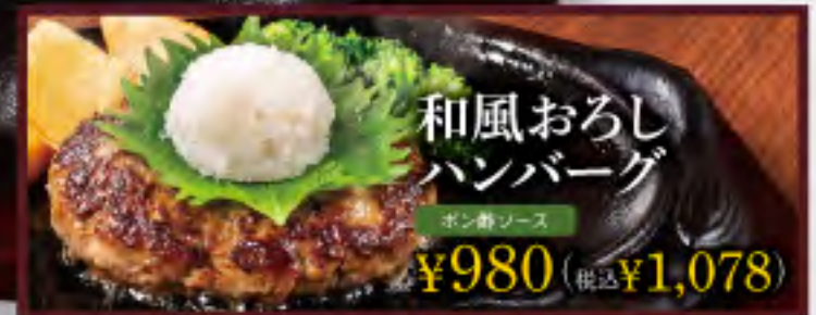
和風おろしハンバーグ オニオンソース ¥980 (税込¥1,078)