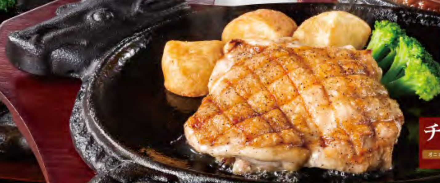
チキンステーキ オニオンソース ¥890 (税込¥979)