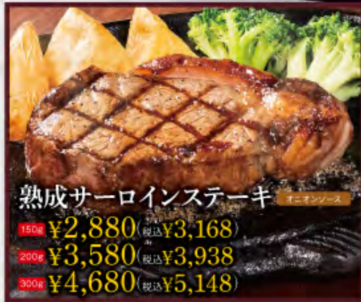
熟成サーロインステーキ オニオンソース 150g ¥2,880 (税込¥3,168) 200g ¥3,580 (税込¥3,938) 300g ¥4,680 (税込¥5,148)