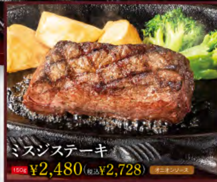
ミスジステーキ オニオンソース 150g ¥2,480 (税込¥2,728)