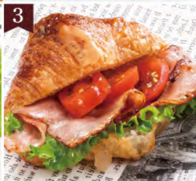
BLT〜ベーコン・レタス・トマト〜