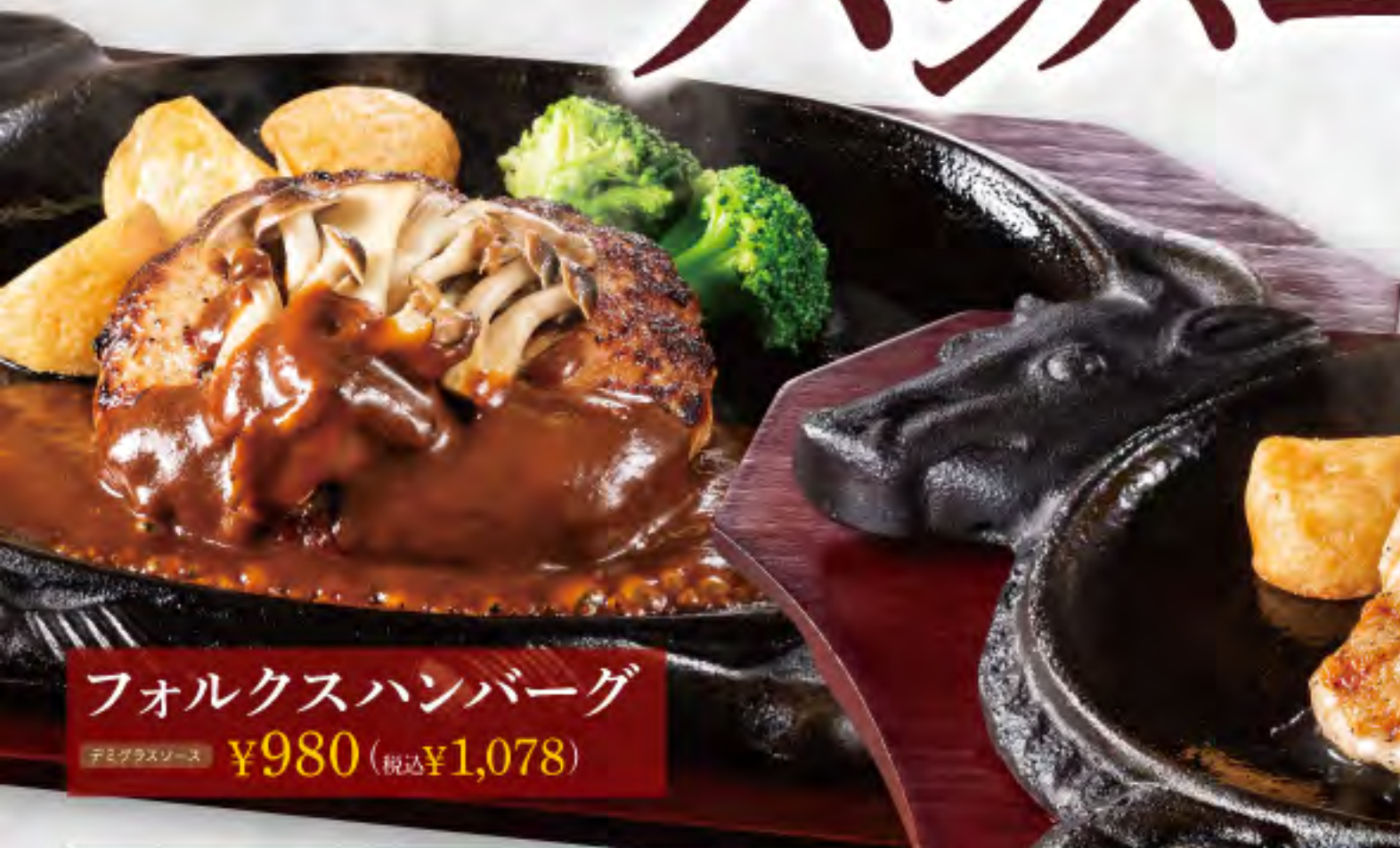
フォルクスハンバーグ デミグラスソース ¥980 (税込¥1,078)