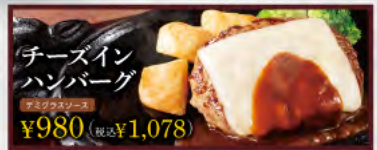
チーズインハンバーグ デミグラスソース ¥980 (税込¥1,078)

※写真は全てイメージです。※料理の付け合わせは予告なく変更する場合がございます。