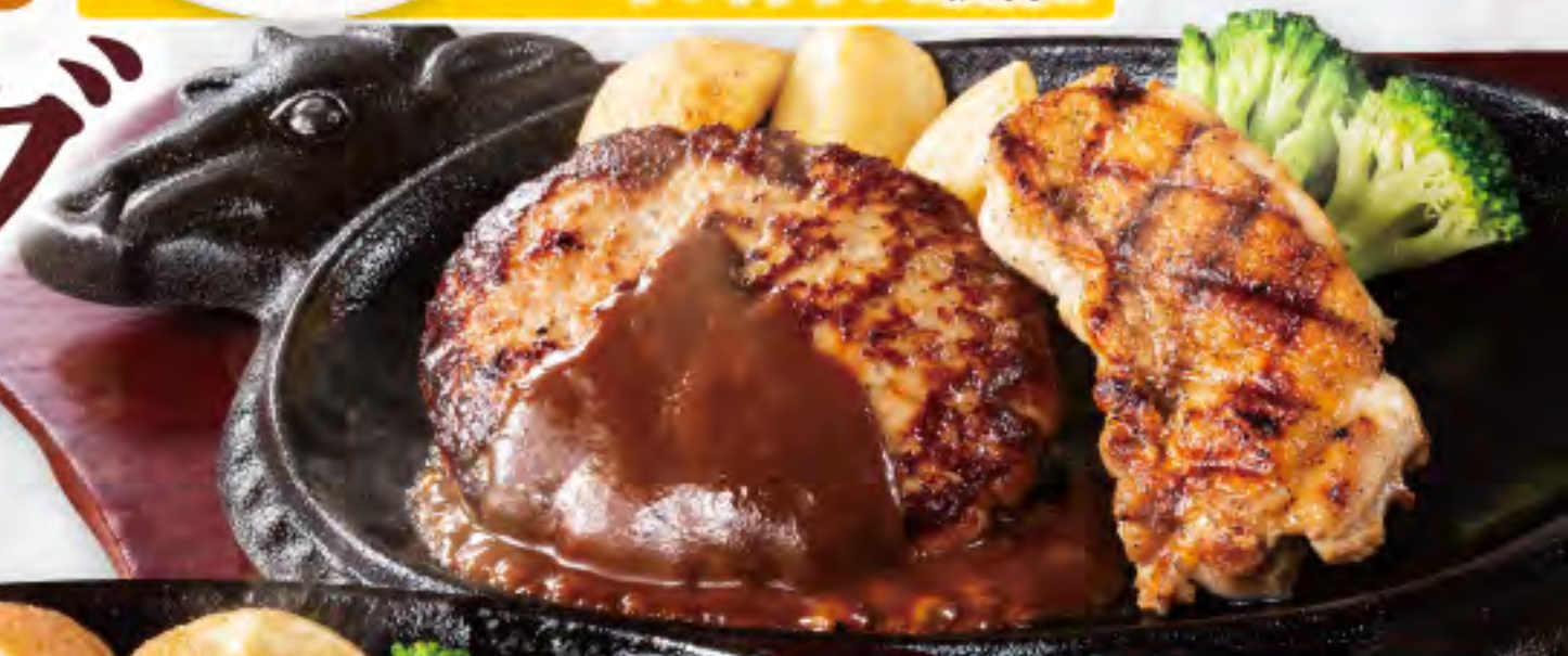
ハンバーグ&ハーフチキン デミグラスソース ¥1,280 (税込¥1,408)