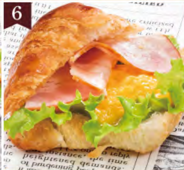
とろっとタマゴベーコン